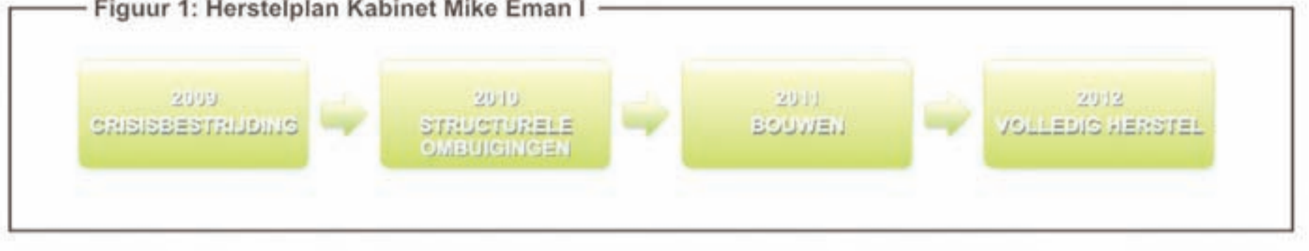
Figuur 1: Herstelplan Kabinet Mike Eman I

UN informe ricibi for di Gobierno ta indica cu e motor di e crecemento economico di Aruba ta continua den 2012 tambe, apesar di suspension di operacion di refineria. E empuehe aki ta wordo sosteni pa e crecemento den turismo y e inversionnan riba tereno di infraestructura y mehoracion urbano. E desaroyo di nos economia tin un relacion directo cu e entradanan di Gobierno. Te cu april 2012 e entradanan di Gobierno ta 7% mas halto cu e mesun periodo año pasa. Apesar cu e refineria a suspender su operacion, por a nota cu e entradanan di Gobierno a keda